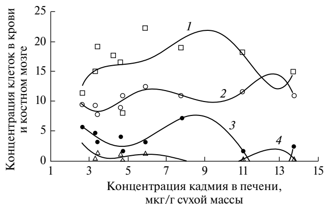
Рис. 3. Изменение клеточности костного мозга (1), концентрации эритроцитов (2), лейкоцитов (3), ретикулоцитов (4) крови в сопоставлении с уровнем накопления кадмия в печени красной полевки с опытного участка СУМЗ.

отражает один из способов регуляции функций кроветворной системы, поскольку количественные изменения любого элемента системы крови невозможны без вовлечения в процесс других компонентов [41].