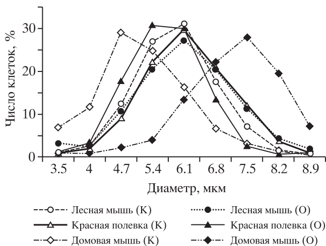
Рис. 1. Состав эритроцитов с разным диаметром у мелких млекопитающих с контрольной (К) и опытной (О) территорий ВУРСа ( Ap. sylvaticus , Cl. rutilus ) и ТРАСа ( M. musculus ).

организма, чем общее число лейкоцитов в крови (Гаркави и др., 1990). Действительно, число лейкоцитов в крови животных не различается, отмечена лишь тенденция к нарастанию у особей с загрязненных территорий, тогда как соотношение типов клеток изменяется. Так, у домовой мыши (ТРАС) величина лимфоцитарно-нейтрофильного профиля с загрязненной территории снижается (составляет 2.4 против 3.5), у животных с ВУРСа возрастает (в 1.6 и 1.7 раза) вследствие разнонаправленного изменения числа нейтрофилов и лимфоцитов (рис. 2). Тенденция к увеличению (до 116%) числа лимфоцитов у животных с ВУРСа, можно полагать, направлена на усиление иммунной защиты организма. В формуле крови отмечен сдвиг влево (отношение числа миелоцитов, мета-