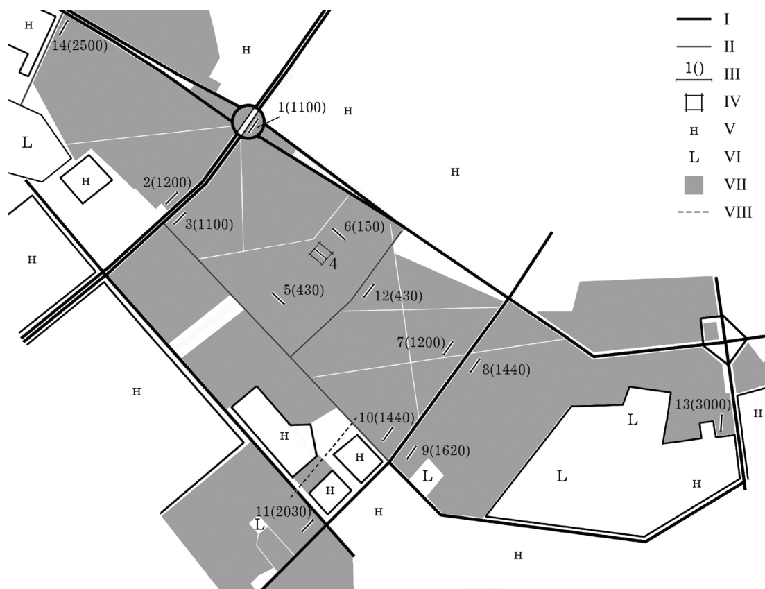
Рис. 1. Схема экспериментальной площадки.

I – асфальтированные дороги; II – грунтовые дороги; III – учетные линии (в скобках – дистанция до площадки мечения); IV – площадка мечения; V – городская застройка высокой плотности; VI – городская застройка низкой плотности; VII – лес; VIII – ландшафтный коридор