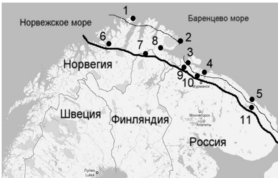
Рис. 1. Район исследования комплекса клавариоидных грибов в безлесных и лесистых районах севера Фенноскандии. Тонкая линия – северная граница распространения березы ( Betula szerepanovii ) и/или сосны ( Pinus sylvestris ); толстая линия – северная граница северной тайги [Ahti et al., 1968].